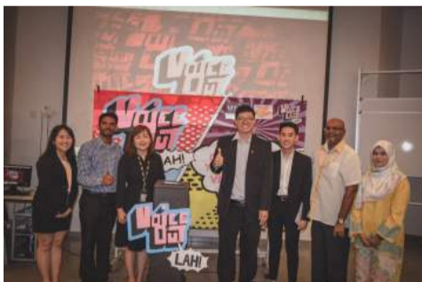
优大公关系心理健康醒觉运动 逾千人参与