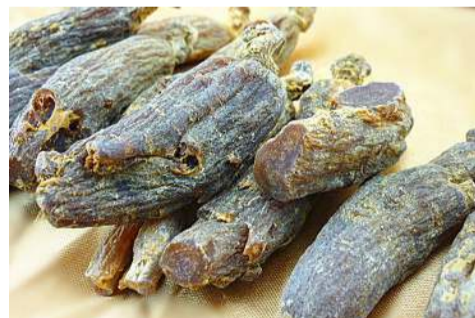
震惊！吃这个，脂肪就会消失！